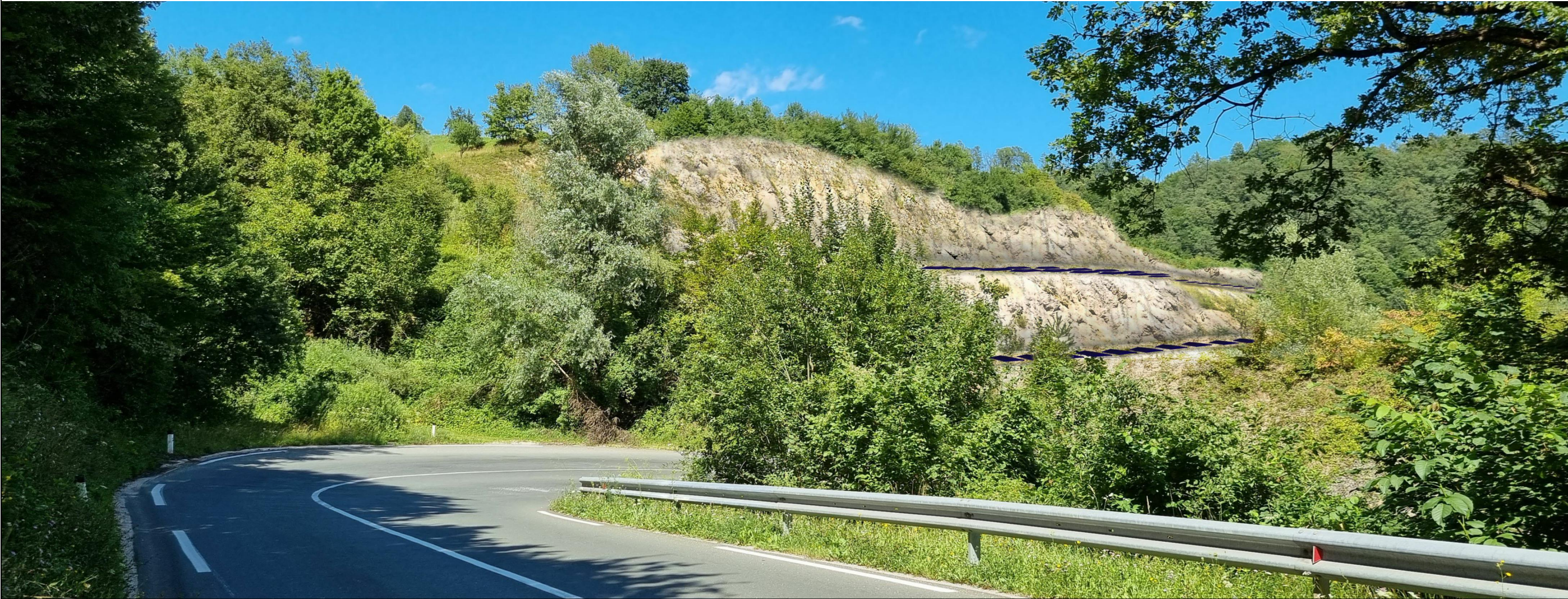
Pogled 2 - Vizualizacija predlaganih rešitev na z regionalne ceste R1-216/1158 Žužemberk-Dvor v smeri Dvora. Pogled na platoje sončne elektrarne pred ostrim ovinkom regionalne ceste.